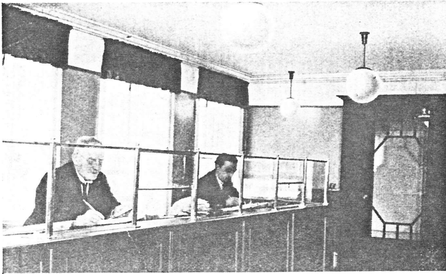
Det nuværende Kassererkontor.

form har ikke altid vist sig lige smidig og hensigtsmæssig, men den sikrer i hvert Fald Medlemmerne den videstgaaende Indflydelse paa Afgørelsen af Forbundets Anliggender.